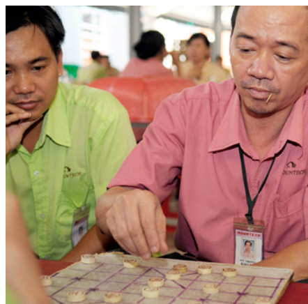
Industrielle Bekleidungsproduktion ist nirgends auf der Welt ein Ponyhof; der Blick in eine chinesische Firma ist nur ein Beispiel. Wichtig sind soziale Standards, wie etwa ausreichende Pausenzeiten.

ne, reguläre Arbeitszeiten, Vermeidung exzessiver Überstunden oder Ausbildung und Schulung in den Fabriken.